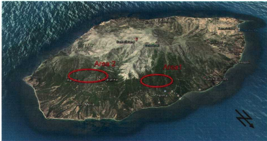
Εικόνα 1. Περιοχή μελέτης των δασικών συστημάτων α) Νότια από τα Θέρμα και β) ΝΑ από την Άνω Μεριά (Heiling 2018).